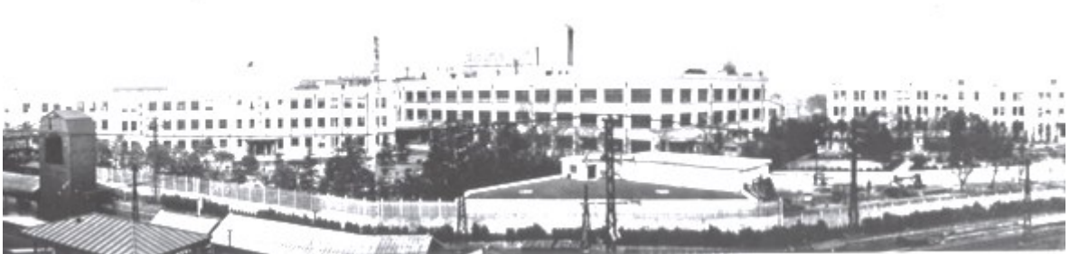
合併当時の東京電気 川崎工場(旧堀川町工場—2000年閉鎖)

この頃の日本は、戦時中で鉄・鋼材が貴重な資源であったため、家庭電化製品の生産が禁止され、苦しい時代を迎えることになった。