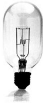
世界初の二重コイル