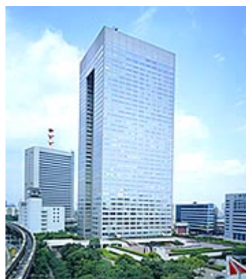
東芝ビルディング

また、1999年（平成11年）に社内カンパニー制を導入し、8つのカンパニー（当時）が誕生した。各社内カンパニーに権限を委譲し、自主責任体制の確立と迅速な経営判断が行われるようになった。