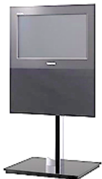
世界初、ガラスレス 3D TV

パラダイムが大きく変化した。国家の枠組みを越えたグローバル競争が激しさを増す中、企業としての成長を続けるために、収益基盤を強化するための「事業構造改革」と、成長分野を強化しつつ新たな事業を立ち上げる「事業構造転換」を実施している。これにより、 コスト競争力と商品力に優れた世界初・世界 No.1 の商品・サービスを展開するとともに「集中と選択」をさらに進め、グローバルトップへの挑戦を続けている。