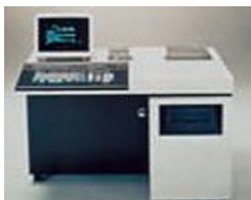
日本初、日本語ワードプロセッサ

1973年（昭和48年）からのオイルショックによる景気の悪化に伴い、「利益は企業活力の源泉、技術は企業発展の推進力」の考えの下、技術力強化のために研究開発を積極的に推進し、将来の糧となる研究を加速させ、世界初、日本初の多くの技術を世の中に送り出した。